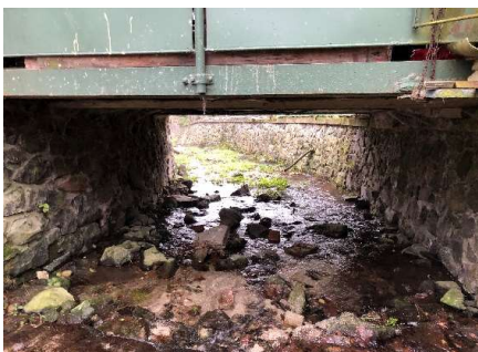
B-koryto pod mostem (Novákovi)