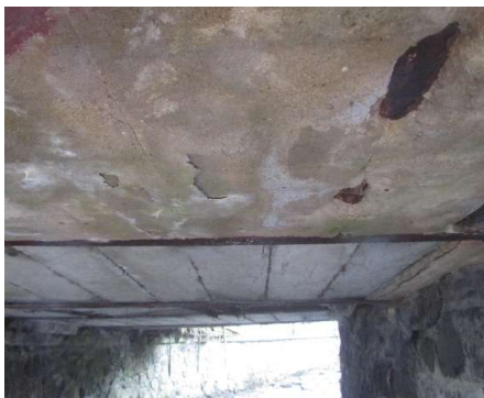
B-spodní hrana mostní konstrukce (Novákovi)