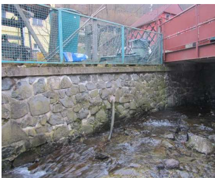
A 10, 21-Pravá zeď u můstku