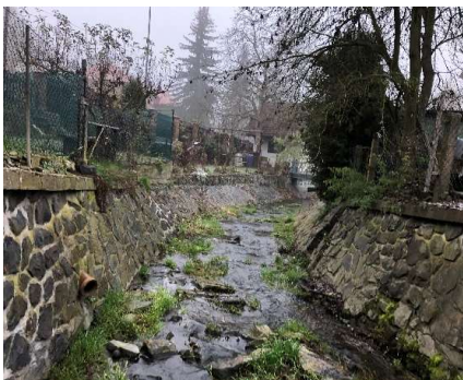
Skluz, přechod do lichoběžníkového PF