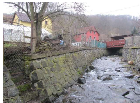
A 10, 21-Pravá zeď a dno