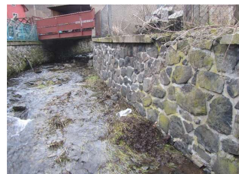
A 10, 30-Levá zeď a dno